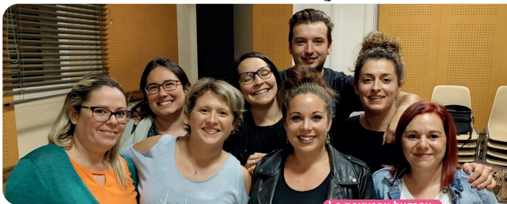
Le nouveau bureau

> Nous devons rebondir et nous rattraper. Nous sommes déjà un bon noyau fraternel mais nous attendons encore plus de « bons vivants » pour venir partager nos moments conviviaux tels que la galette, le repas champêtre de juin et surtout notre incontournable vente festive de décembre.