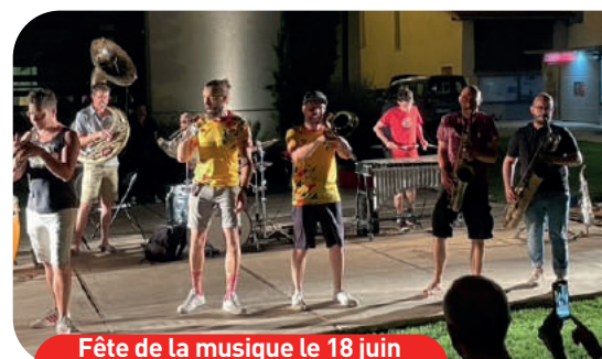
Fête de la musique le 18 juin Les Monstroplantes

> Le spectacle de l'école élémentaire, « Nous les Tziganes », a été accompagné par le quatuor d'anche de l'école de musique. Un moment riche.