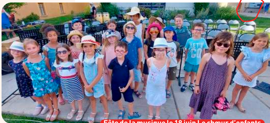
Fête de la musique le 18 juin Le chœur d'enfants

> Des Auditions de Poche s'organiseront le samedi 28 janvier à 14h et le samedi 4 février à 11h. Il s'agit de petites représentations publiques de nos élèves. Souvent l'occasion d'un premier concert pour nos élèves débutants mais également des essais pour les plus alertes.