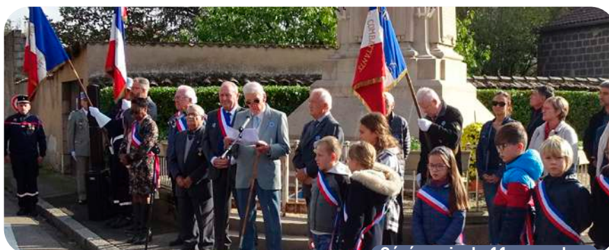
Cérémonie du 11 novembre

> Au sujet des manifestations, le 8 mai et le 11 novembre ont vu une participation exceptionnelle de l'ensemble de la population avec aussi le conseil municipal d'enfants et les enfants des écoles. Nous avons participé aussi aux différentes cérémonies : au TATA Sénégalais en juin, le 14 juillet, en souvenir des Harkis le 25 septembre à la Duchère, au cimetière à la Toussaint avec le Souvenir Français ou encore au mémorial départemental des défunts d'AFN le 5 décembre.