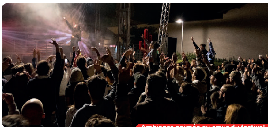
Ambiance animée au cœur du festival

1200 participants issus de toutes les générations au plus fort des festivités ! Il faut dire que la qualité de la programmation est montée d'un cran pour le plus grand plaisir des festivaliers quincerots... mais pas que.