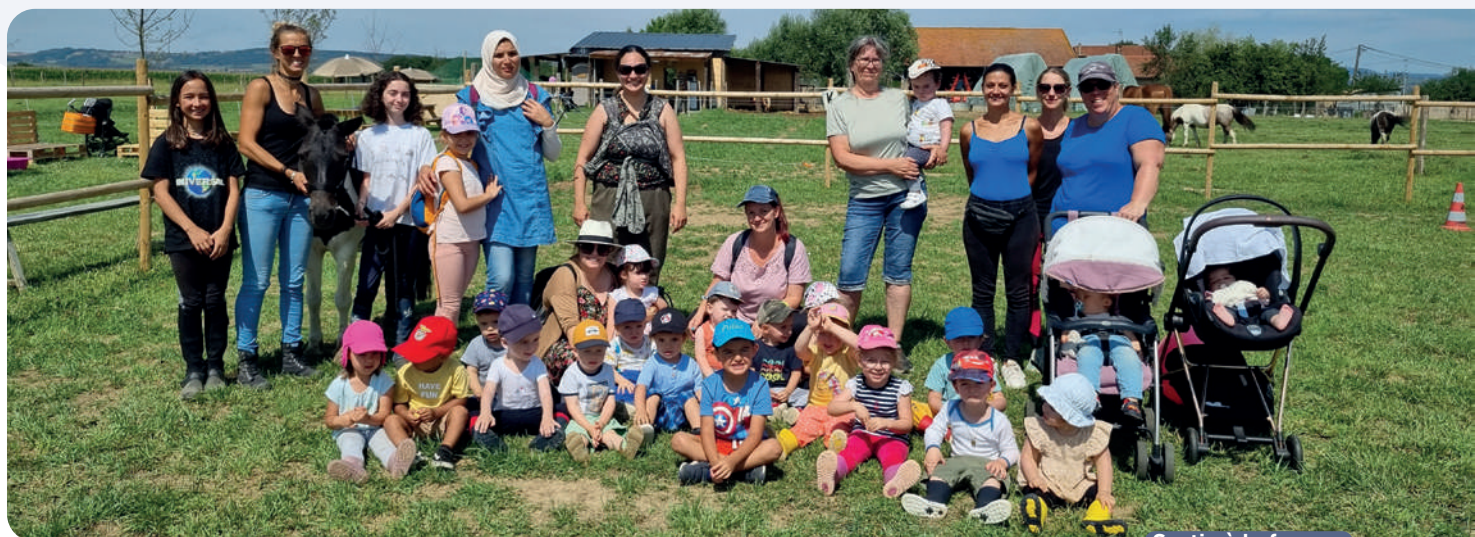
Sortie à la ferme

> Le traditionnel pique-nique partagé avec les parents a eu lieu comme chaque année au parc de la mairie le 8 juillet dans la joie et la bonne humeur.