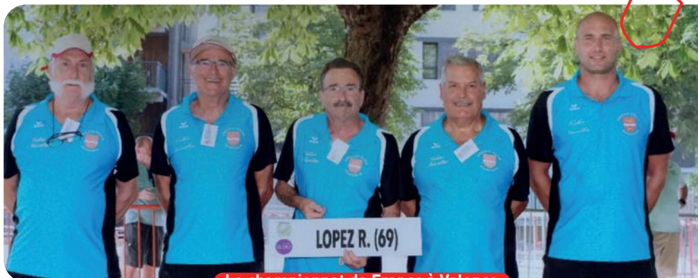
Le championnat de France à Valence