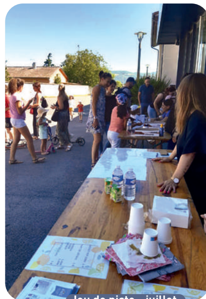
Jeu de piste - juillet

> Si vous souhaitez vous investir et apporter votre contribution lors de nos futurs événements, n'hésitez pas à nous contacter et à nous rejoindre.