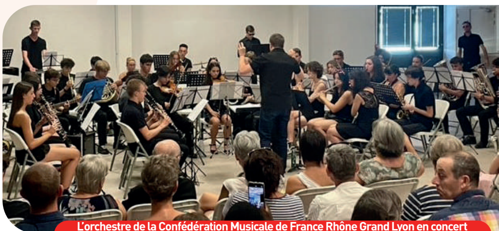
L'Orchestre de la Confédération Musicale de France Rhône Grand Lyon en concert à la MJC lors de son retour de leur stage d'été

> Les Orchestrades : Chaque année, nous accueillons des orchestres amis, afin de partager une soirée musicale. Cette année, nos amis de Saint-Cyr et Brassaventure seront avec nous pour cette soirée du samedi 4 mars. Le lendemain, nous accueillerons la grande harmonie de Caluire (50 musiciens) !