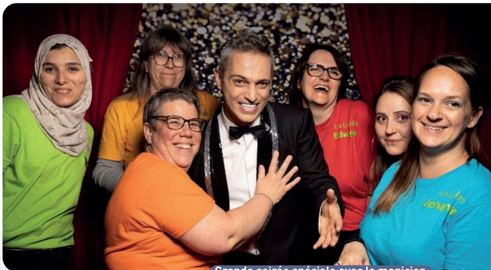
Grande soirée spéciale avec le magicien

> Au mois de mars, les Lucioles ont pu bénéficier de la salle Philippe Gagnière à la Maison des Associations deux mardis par mois afin de se réunir et de proposer différentes activités aux enfants jusqu'aux vacances d'été. Psychomotricité, chants, racontes tapis, activités manuelles et bien d'autres sont au programme. Nous sommes dans l'attente de pouvoir de nouveau profiter de cette salle prochainement. Nous aimerions proposer une animation musique et sophrologie.