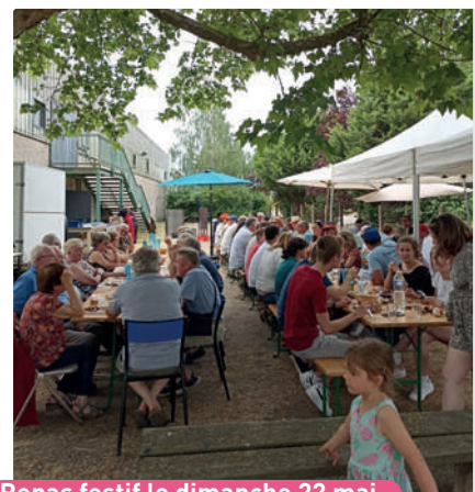
Repas festif le dimanche 22 mai

Samedi 11 février - 8h / 13h - Place de l'église