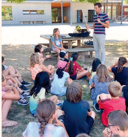
Présentation d'instrument flûte traversière à l'école primaire

> Les examens nationaux instrumentaux du canton se sont déroulés à Quincieux. Un jury de renommée nationale est venu apprécier le niveau des élèves du canton. Un rayonnement sans limite.