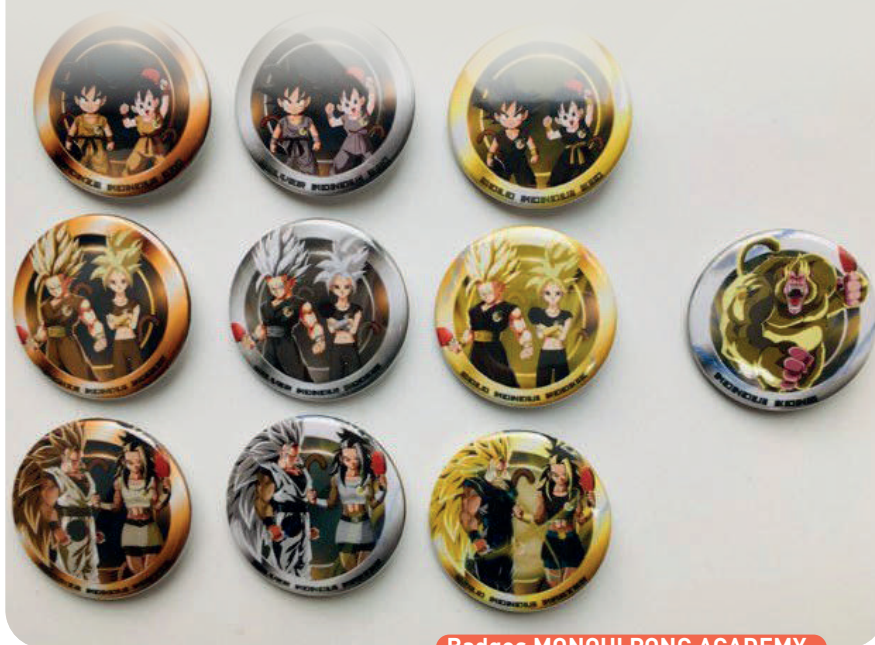
Badges MONQUI PONG ACADEMY