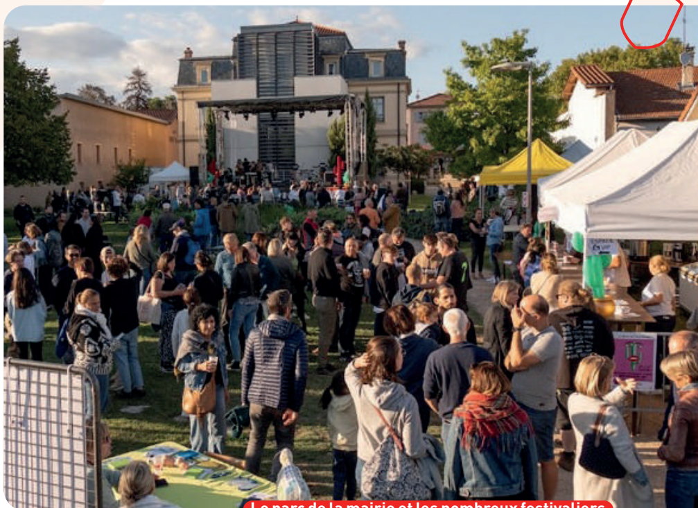
Le parc de la mairie et les nombreux festivaliers

> Quelle satisfaction pour la quarantaine de bénévoles de l'association de voir le parc de la Mairie bondé, rassemblant plus de