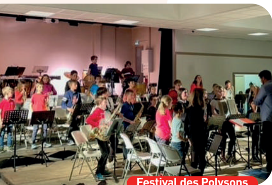
Festival des Polysons

Q uincieux est depuis longtemps une référence au niveau de son école de musique : le rayonnement de ses actions, concerts, spectacles et les résultats pédagogiques, l'attractivité ultra territoriale, sa voix très écoutée et sa voie très suivie au niveau de la Confédération Musicale de France.