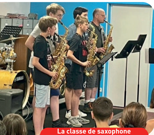
La classe de saxophone lors des Auditions de Poche

Nous avons entamé le spectacle le plus long du monde, qui a débuté le 10 septembre et finira le 3 juin ! Chaque concert apporte sa pierre à l'édifice de l'histoire. Vous avez raté un évènement ? Pas de souci, cela n'empêche pas la compréhension et tout vous sera dévoilé lors du grand final !