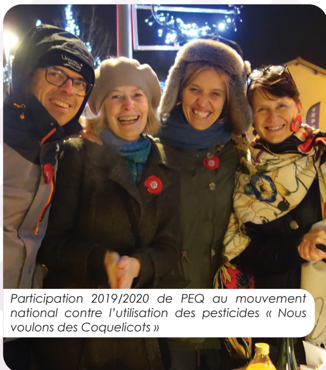
Participation 2019/2020 de PEQ au mouvement national contre l'utilisation des pesticides « Nous voulons des Coquelicots »