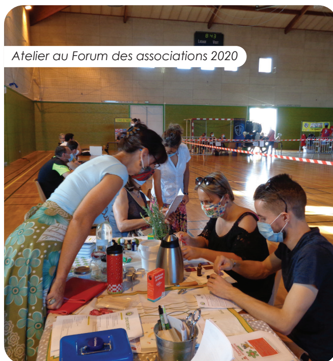
Atelier au Forum des associations 2020

◆ Pour toutes demandes d'informations, idées d'actions pour l'environnement, échanges, soutien et bien sûr, si vous souhaitez nous rejoindre au bureau ou en tant qu'adhérent (5€ l'adhésion), vous pouvez nous contacter par mail. Suivez-nous aussi sur notre site Facebook.