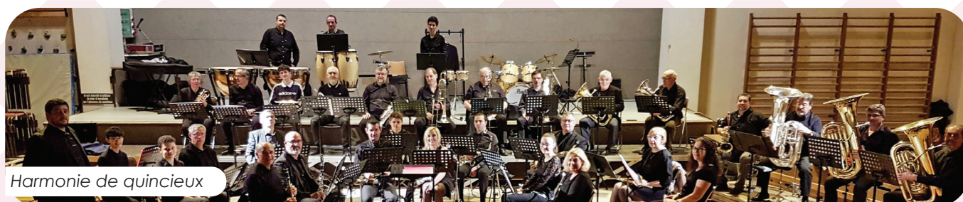
Harmonie de quincieux

◆ Nous avons ouvert des classes de flûte et de cor gratuitement aux enfants débutants vivant à Quincieux. Une nouvelle preuve de notre volonté d'ouverture et de rendre accessible la musique au plus grand nombre.