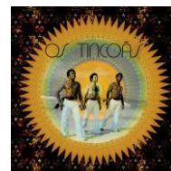
Deixa A Gira Gira Os Tincóas

Alors, dans votre panier de cette semaine, vous trouverez, entre autres : une nouvelle sélection télévisuelle encore très largement inspirée du décryptage de Télérama et de ses critiques (rendons à César...), une expérience totalement inédite proposée par le cinéma Les 400 Coups (notre chaleureux soutien à cette initiative locale !), un joyeux duo breton sacrément vivifiant, et puis quelques bricoles des internets, et puis de nouveaux airs à passer dans votre jukebox, et puis et puis ... un peu de lecture amoureusement glanée et patiemment recopiée, juste ... pour vous.