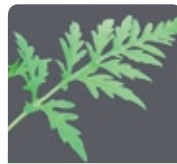
Ses feuilles découpées et vert vif sur les deux faces.